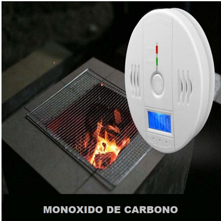
MONOXIDO DE CARBONO